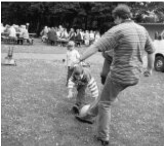
Die Kleinen hatten Gelegenheit zum Spielen und wie man sieht die Großen auch.