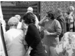
Nach dem Kaffeetisch wurde die Rückreise angedelt. Über eine andere Strecke führte der Nachhauseweg zunächst zum Sportplatz in Eppinghoven. Dort wurde wieder eine Rast eingelegt.